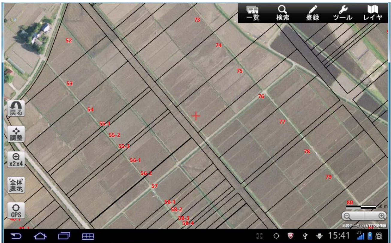
タブレット型情報端末による一時利用地指定図の表示