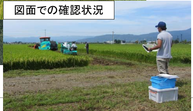
図面での確認状況