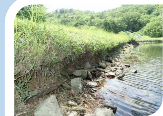
上流法面が侵食されている状態