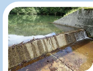
洪水吐のひび割れから漏水している状態