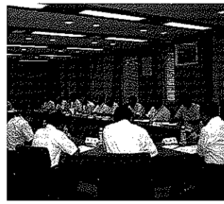
平成22年度 岡山県農地防災・ため池等整備事業推進協議会会員名簿