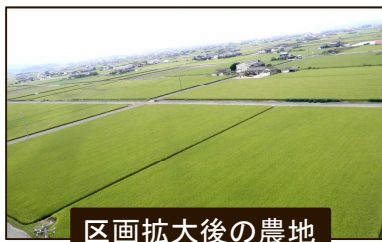
区画拡大後の農地