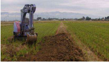
区画拡大（畦畔除去）