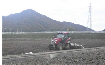
区画拡大（切盛・均平）