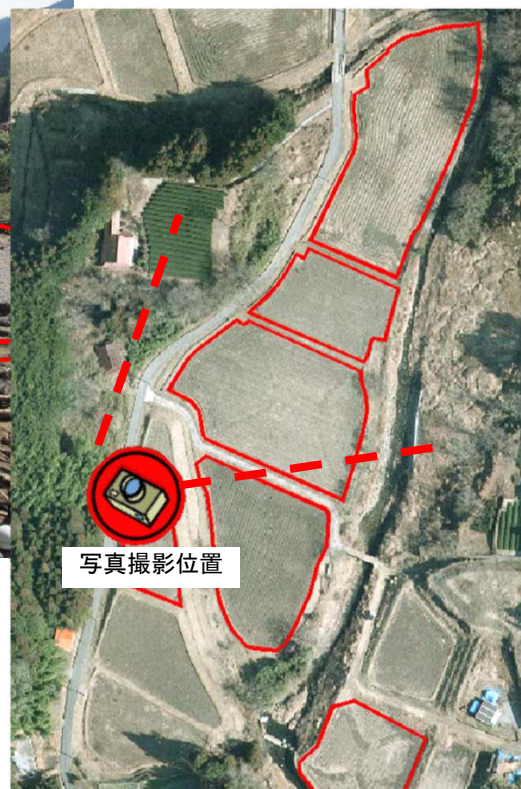
災害査定対象農地