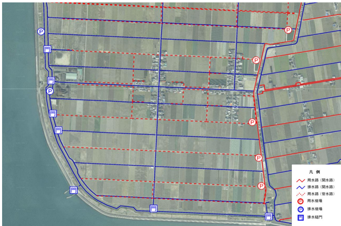
土地改良区の既存の資料や聞き取りを基に作成した用排水路網図