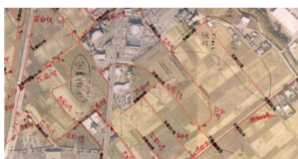
土地改良区へ位置情報の確認を行った図面