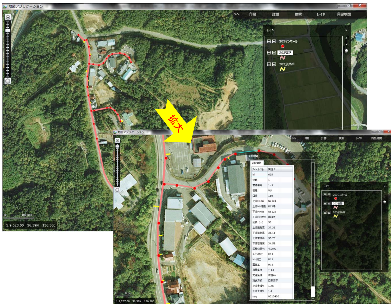
Web版農地・施設情報管理システムの操作画面