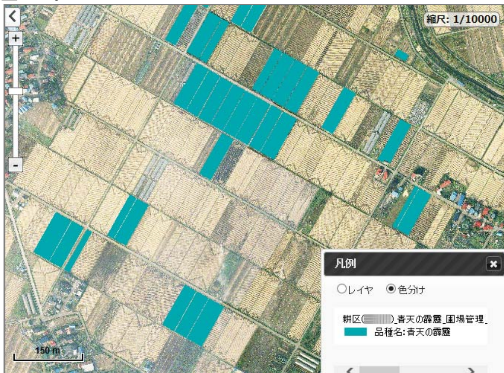
特A米「青天の霹靂」作付状況